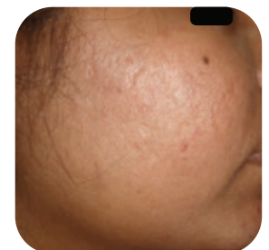
Na 1 behandeling