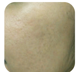
Na 4 behandelingen