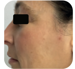
Na 2 behandelingen