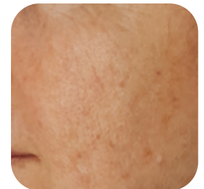
Na 1 behandeling